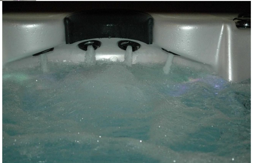
Jets de nuque